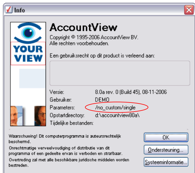
Figuur 2: Parameter(s) controleren.